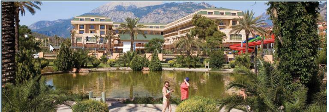
Ricordi Turchia 2009

CRYSTAL HOTEL 5* a Kemer / Antalya ( http://www.crystalhotels.com.tr/new/deluxe/eng/index.asp )